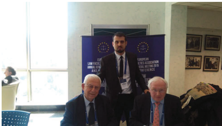
Slika (3): Rukovodilac Departmana za pravne naune Univerziteta u Novom Pazaru, sa predsednikom ELFA i potrprednikom ELFA