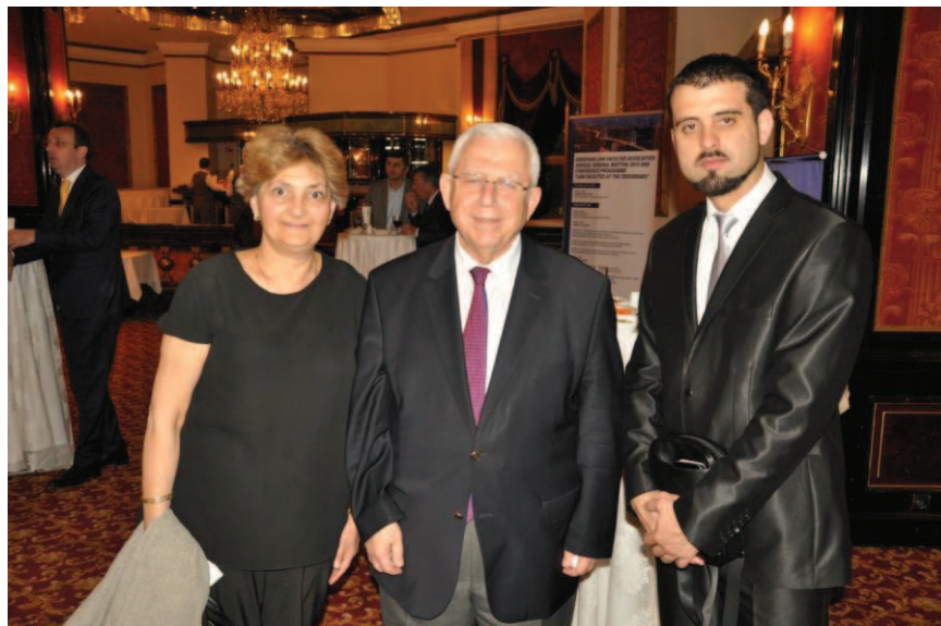
Slika (1): Rukovodilac Departmana za pravne naune Univerziteta u Novom Pazaru sa učesnicima Genralne skupštine ELFA 2015. - Istanbul.