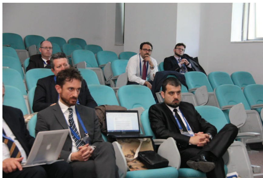
Slika (2): Rukovodilac Departmana za pravne naune Univerziteta u Novom Pazaru, učesnik u panelu - Evropsko krivično pravo, Dosadašnja iskustva i narednih deset godina.